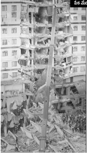
పేక మేడల్లా కూలిన భవనాలు